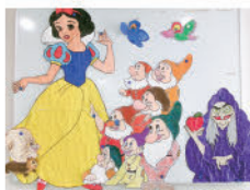
利用者作品「白雪姫」