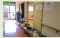
リユースステーション

参加費お一人100円(3歳以下は無料)です。こどもの遊び場、喫茶スペース、リユースステーションを設けています。ぜひ一度遊びにきてください！