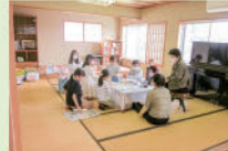
廃材を使って工作