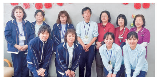
在宅介護部門 職員一同

高齢者虐待防止など人権擁護の視点を持ちながら業務を行います。また、ご利用者本人だけでなく、ご家族の方々等、周囲の方々、生活環境等にも必要があれば取り組んでいきます。