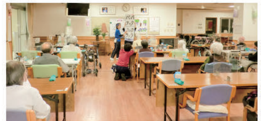
食事前の口腔体操風景

社会福祉法人等による利用者負担軽減制度についても市に働きかけながら行っています。