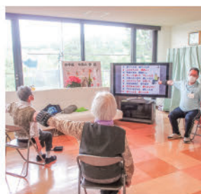
こけないからだ体操

ただ漠然と日々を過ごすということではなく、生き生きとした日々を送っていただくことを目標とし、ご利用者のやる気を引き出すような取り組みを行い、「一日でも長く自立した生活が送れる」、「第2日本原荘に入りたくてもらえる」施設の実現を目指します。